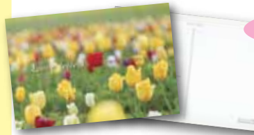
▲ポストカード写真集 (横 148×縦 100)