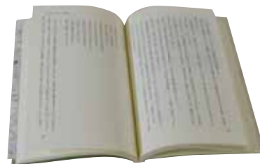
▲念願がかって一冊の本になった、はなさんの生涯